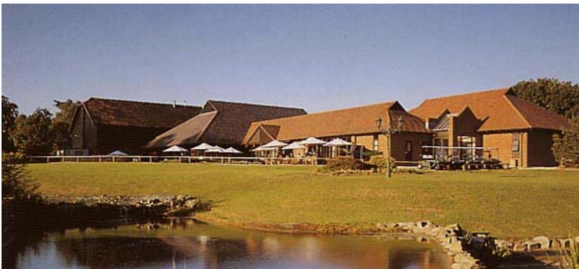
Marriott GOODWOOD PARK Hotel & Country Club

ソールズベリからさらに南東へ進みサウサンプトン (Southampton) から高速道路M27に入り、一気にハバント (Havant) まで進み、さらにA27でチッチェスター (Chichester) の市街地を迂回したところから地方道に入り、案内板にしたがってマリオット系列のグッドウッドパークホテルに着いた。このホテルにはゴルフコースが併設されていた。